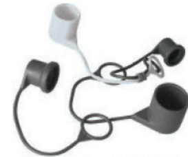
Tampa guarda-pó ISO-16028