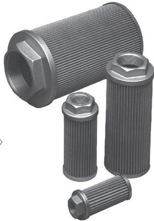
Perda de carga: Óleo 36 St@ 40°C